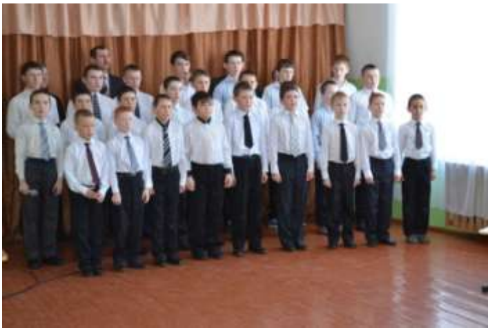
Мужской хор учащихся Старосальинской школы занял 1 место среди хоров района.