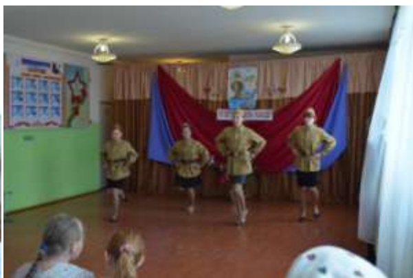
Выступления учащихся Старосальинской школы.