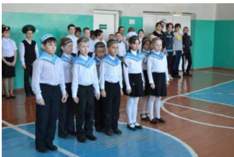
Смотр песни и строя.