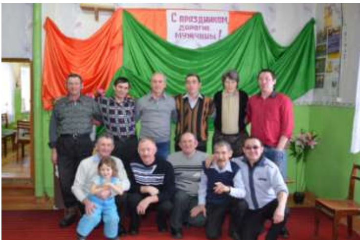
1. «Стенка на стенку»-конкурсная программа для мужчин.