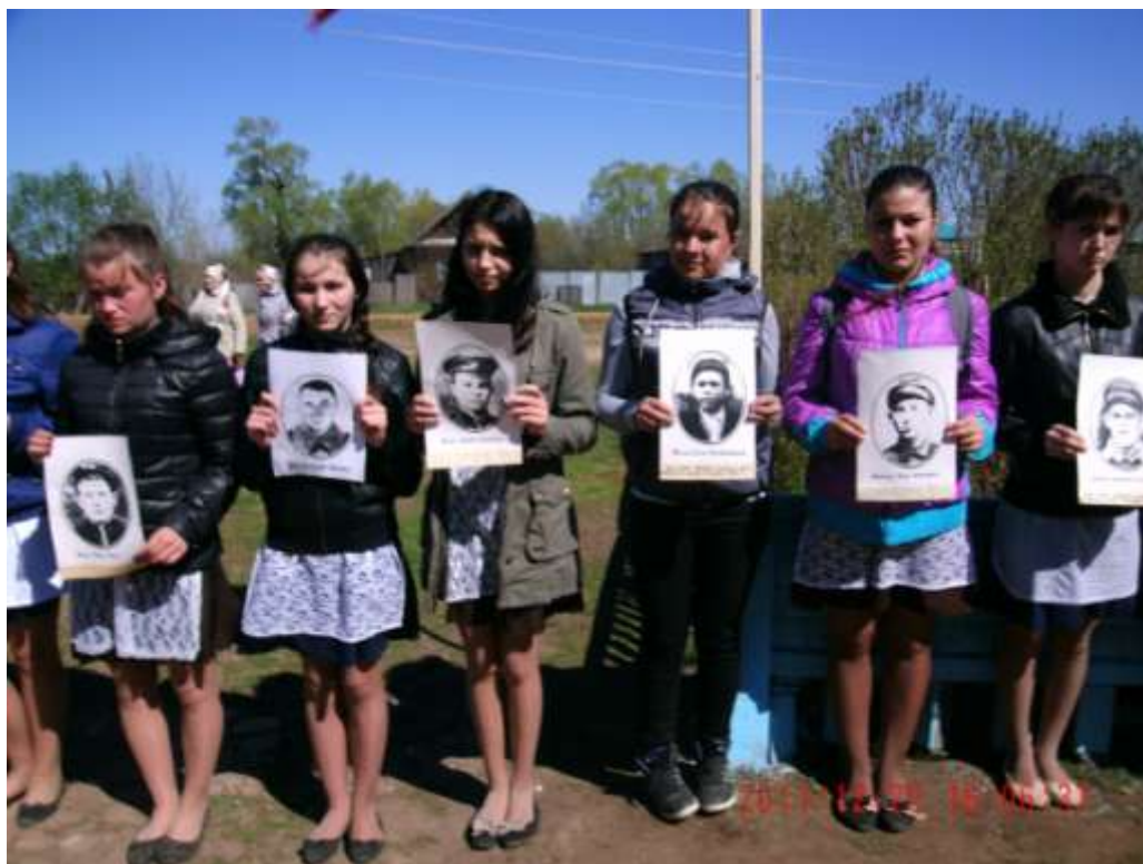
Ученики и жители деревни приняли участие в акции «Бессмертный полк»