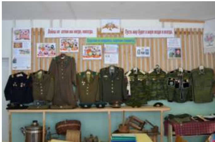
Образцы военной формы разных лет