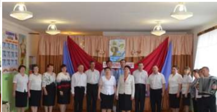
Выступление коллектива учителей