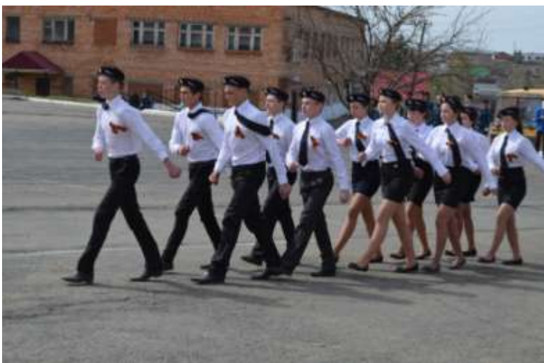
Выступление Старосальинских учащихся на районном конкурсе «Смотр песни из строя».