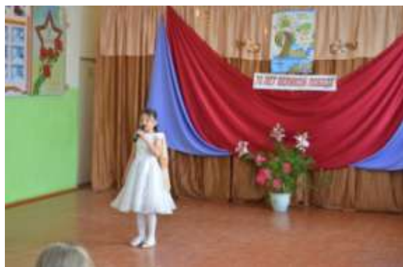
Поет Сорокина Диана.