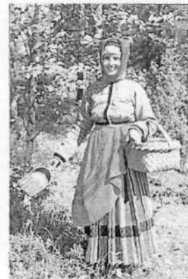
Шамшюра – женский чепец из

холста или шапочка под платок, кокошник. Шапочный промысел являлся основным в жизни крестьян села Молвитино Буйского уезда Костромской губернии. В тверских краях - шамшурить – перешепываться, шушукаться, а на русском Севере – прозвище ШАМШУРА – доставалось человеку картавому.